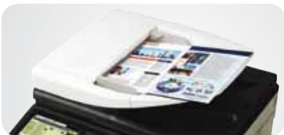
Chargeur recto-verso 100 feuilles

Le MX-2310U vous étonnera par son niveau de performances pour un système si compact. Tout est réuni pour satisfaire vos collaborateurs : compacité, efficacité et convivialité.