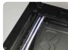
Lampes LED basse consommation