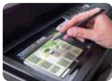
Styler en standard