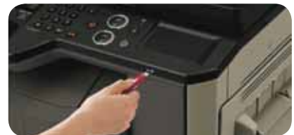
Impression à la demande à partir d'une clé USB