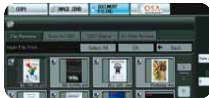
Visualisation des documents stockés sous forme de vignettes couleur