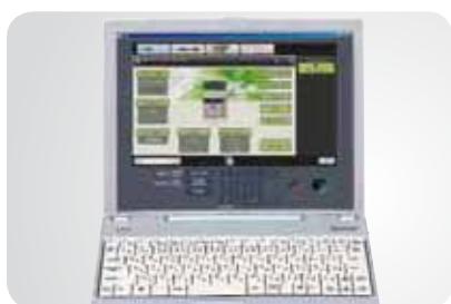
Accès à distance au panneau de commandes

Et ce n'est pas tout ! De nombreux outils permettent de simplifier au quotidien, le travail de l'utilisateur comme de l'administrateur.