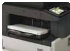
Unité de finition interne