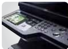
Ecran tactile couleur